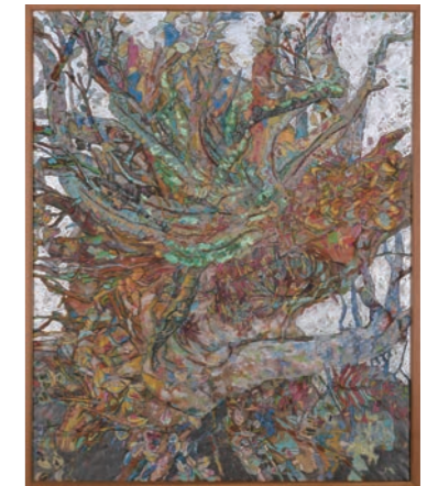
しらつゆ 「白露のタニワタリ」